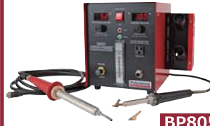
BP8054-0300 8200-J シングルガス仕様