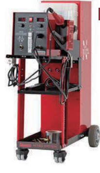
BP8054-0000 8203-J 窒素発生装置仕様