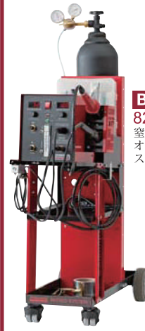
BP8054-0100 8202-J 窒素ボンベ オートマッチック スイッチ仕様