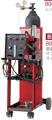
BP8054-0500 8002-J 窒素ボンベ用 マニュアル スイッチ仕様