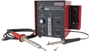
BP8054-0700 8000-J シングルガス仕様