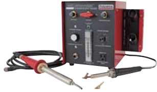
BP8054-0600 8001-J デュアルガス マニュアルスイッチ仕様