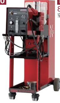
BP8054-0400 8003-J 窒素発生装置仕様