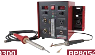
BP8054-0200 8201-J デュアルガス オートマッチック スイッチ仕様