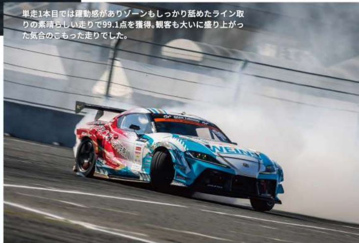
単走1本目では運動感がありゾーンもしっかり舐めたライン取りの素晴らしい走りでの99.1点を獲得。観客も大いに盛り上がった気合のこもった走りでした。