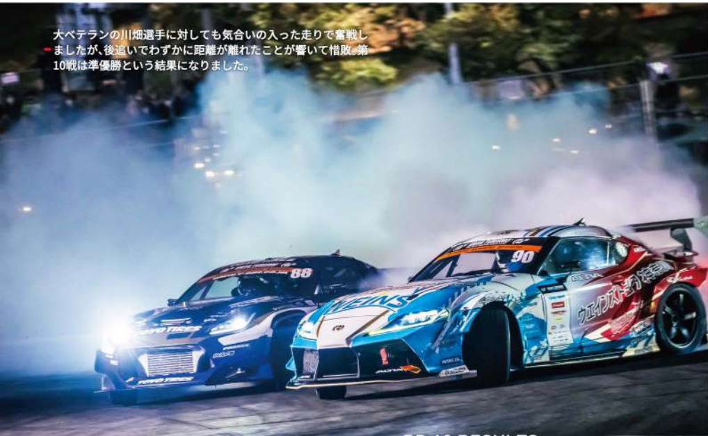
- RD.10 RESULTS - Tanso 4th / Tsuiso 2nd