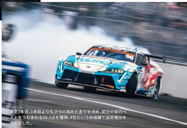
単走2本目。1本目よりもさらに攻めた走りを決め、前日の自己ベストをうわまわる99.5点を獲得。4位という好成績で追走進出を決めました。

しかし加速区間でやや離されてしまったことが響いたのか後追いポイントは10.3に留まり、106.7点对98.2点。最終的には