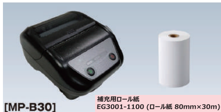
[MP-B30] 補充用ロール紙 EG3001-1100 (ロール紙 80mm×30mm)