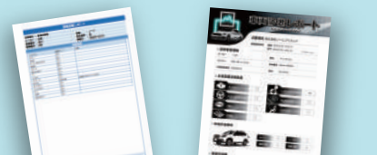
《Diag Printout II》

SSSシリーズでは、内蔵の[Diag Printout II]とお手持ちのタブレットまたはスマートフォンを使用した[EASY Report Plus]で診断レポートを発行可能 カーオーナーへの提案・エビデンスとしてご活用いただけます