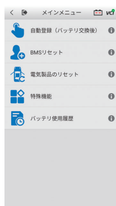
バッテリーリセットメニュー