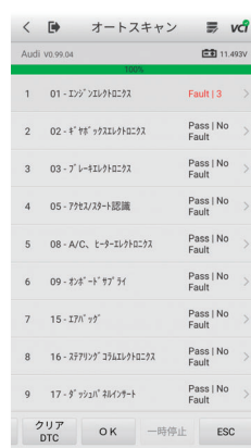
自動スキャンでDTC取得