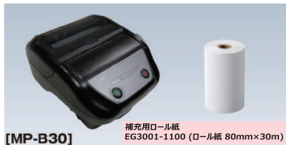
【MP-B30】 補充用ロール紙 EG3001-1100 (ロール紙 80mm×30m)