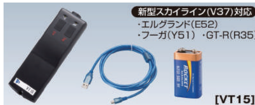
新型スカイライン(V37)対応 ・エルグランド(E52) ・フーガ(Y51) ・GT-R(R35)