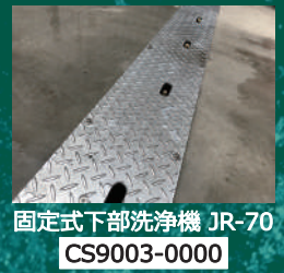
固定式下部洗浄機 JR-70 CS9003-0000