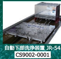
自動下部洗浄装置 JR-54 CS9002-0001