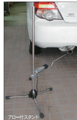
アロー付スタンド