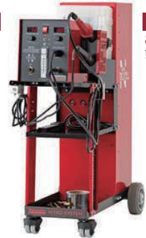
BP8054-0000 8203-J 窒素発生装置仕様