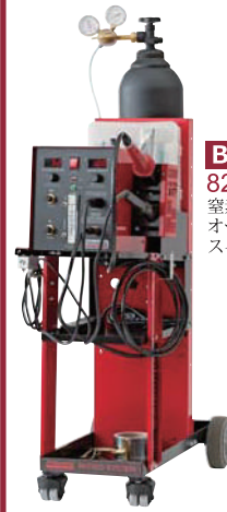
BP8054-0100 8202-J 窒素ボンベ オートマッチック スイッチ仕様