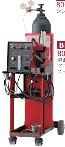
BP8054-0500 8002-J 窒素ボンベ用 マニュアル スイッチ仕様