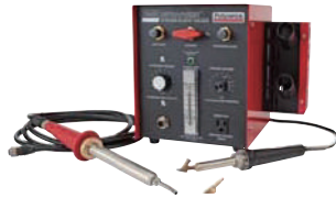
BP8054-0600 8001-J デュアルガス マニュアルスイッチ仕様