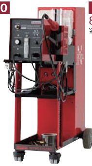
BP8054-0400 8003-J 窒素発生装置仕様