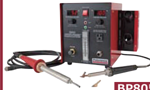
BP8054-0300 8200-J シングルガス仕様