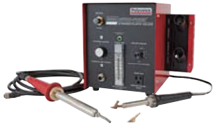
BP8054-0700 8000-J シングルガス仕様