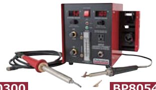
BP8054-0200 8201-J デュアルガス オートマッチック スイッチ仕様