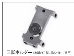
三脚ホルダー (市販の三脚に取り付けて使用)