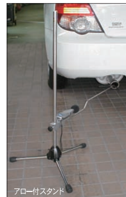
アロー付スタンド